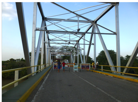
Puente fronterizo colombo-venezolano entre Arauca y Apure Idler, Annette

-Las fronteras son tanto corredores estratégicos para el conflicto armado, como para el crimen organizado, incentivado por la alta presencia de recursos naturales usados para el narco-tráfico en estas zonas