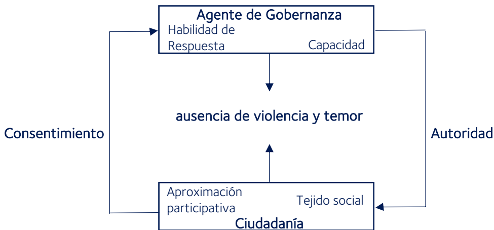
Figura 2.2 p 52

El fortalecimiento del tejido social y la relación entre el Estado y sociedad debería ser la base para reforzar las estrategias de seguridad Con el fin de co-crear iniciativas de desarrollo constantes y de largo plazo para transformar la ilegalidad en proyectos productivos legales.